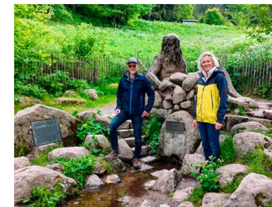
Startpunkt für unser Donau-Projekt ist die Quelle bei Furtwangen im Schwarzwald mit Flussgott Danuvius.